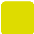
Amarillo HV HV Yellow