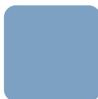
Azul 54 Blue 54

Ofrecemos el servicio de tinter colores especiales y una cantidad mínima de 300 m por color. We have a special color dyeing service and a minimum quantity of 300 m.