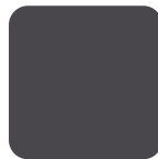
Gris 82 Grey 82