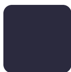
Marino 70 Navy Blue 70

Ofrecemos el servicio de tinter colores especiales y una cantidad mínima de 300 m por color. We have a special color dyeing service and a minimum quantity of 300 m.