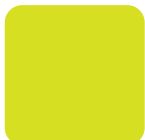
Amarillo HV HV Yellow