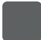
Gris 80 Grey 80