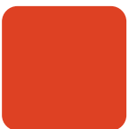
Naranja 20 Orange 20