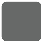
Gris 80 Grey 80