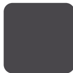
Gris 82 Grey 82