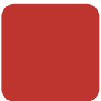
Rojo 30 Red 30