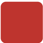
Rojo 30 Red 30