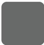
Gris 80 Grey 80