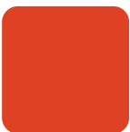
Naranja 20 Orange 20