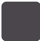
Gris 82 Grey 82