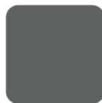
Gris 80 Grey 80