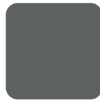
Gris 80 Grey 80