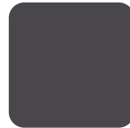
Gris 82 Grey 82