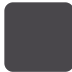
Gris 82 Grey 82