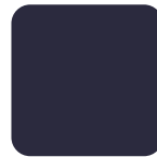
Marino 70 Navy Blue 70

Ofrecemos el servicio de tinter colores especiales y una cantidad mínima de 300 m por color. We have a special color dyeing service and a minimum quantity of 300 m.