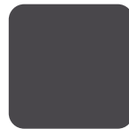
Gris 82 Grey 82