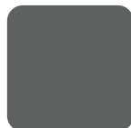
Gris 80 Grey 80