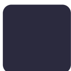
Marino 70 Navy Blue 70

Ofrecemos el servicio de tinter colores especiales y una cantidad mínima de 300 m por color. We have a special color dyeing service and a minimum quantity of 300 m.