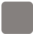
Grey 16-4702 TCX Gris 16-4702 TCX