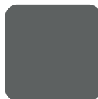
Grey 80 Gris 80