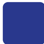
Blue King 2935C Azul Rey 2935C