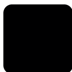
Black G328 Negro G328

We have a special color dyeing service and a minimum quantity of 600 m. Ofrecemos el servicio de tintar colores especiales y una cantidad mínima de 600 m por color.