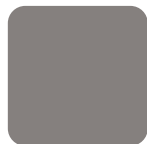
Grey 322 Gris 322