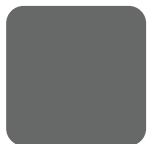
Grey 80 Gris 80