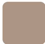
Kaki 412 Kaki 412