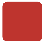
Red 30 Rojo 30