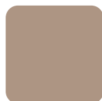
Kaki 412 Kaki 412