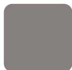
Grey 322 Gris 322