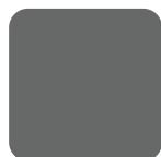
Grey 80 Gris 80