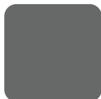
Grey 80 Gris 80