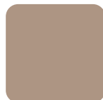
Kaki 412 Kaki 412