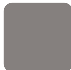
Grey 322 Gris 322