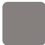
Grey 322 Gris 322