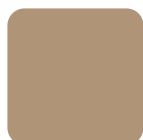
Khaki 412 Khaki 412