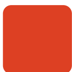
Orange 20 Naranja 20