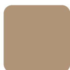
Khaki 412 Khaki 412