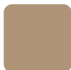
Khaki 412 Khaki 412