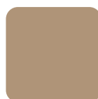
Khaki N429 Khaki N429