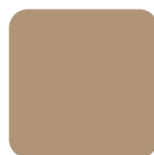
Khaki N429 Khaki N429