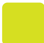
Yellow HV Amarillo HV