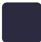
Navy Blue 70 Marino 70

We have a special color dyeing service and a minimum quantity of 600 m Ofrecemos el servicio de tinter colores especiales y una cantidad mínima de 600 m por color.