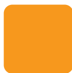
Naranja HV HV Orange