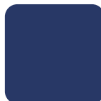
Azulina 50 Royal Blue 50