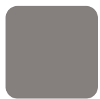
Grey 16-4702 TCX Gris 16-4702 TCX