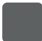
Gris 80 Grey 80