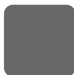
Gris 80 Grey 80